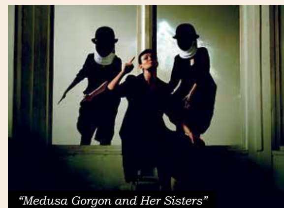
"Medusa Gorgon and Her Sisters"

an ironic reflection of the world of ballet. His one-act ballet " Tulle " at the Moscow Academic Music Theatre , performed as part of the Balanchine-Garnier-Taylor-Ekman event, is a transposition of a 2012 Stockholm production. Principals act as though they are in rehearsals: looking critically and self-indulgently out into the audience as if staring at their reflection in the mirror. Polishing their movements, conversing during crowd scenes, restraining a willfully wildly dancing leg, unafraid of being bright, explosive, disobedient.