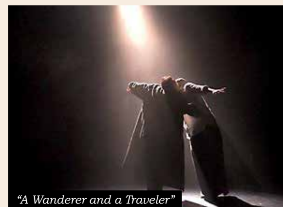
"A Wanderer and a Traveler"