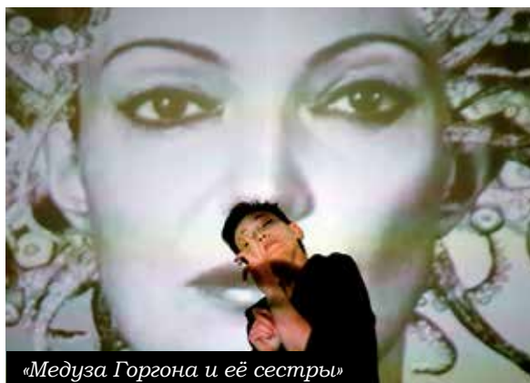
«Медуза Горгона и её сестры»

и Анна Гарафеева поставили разговорно-пластический спектакль «Медуза Горгона и её сестры» по тексту Натальи Осис. Древнегреческий миф о судьбе титаниды пересказан запросто, точно в курилке. Авторы спектакля погружают зрителя в процесс преобразования юной красавицы в ужасающую Медузу Горгону. Свободное движение сочетается с драматической и вокальной линиями спектакля, отсылая к синтезу античного действия. Спектакль переполнен вербальным текстом, и в контексте хореографической лаборатории ему явно не хватает текста хореографического.